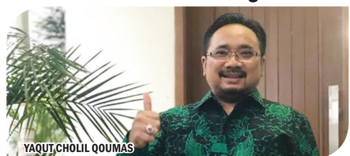
YAQUT CHOLIL QOUMAS

JAKARTA (IM)- Menteri Agama, Yaqut Cholil Qoumas atau Gus Yaqut yang baru saja dilantik menggantikan Fahrcul Razi menegaskan bahwa agama harus dijadikan sebagai inspirasi bukan aspirasi. "Agama sebagai